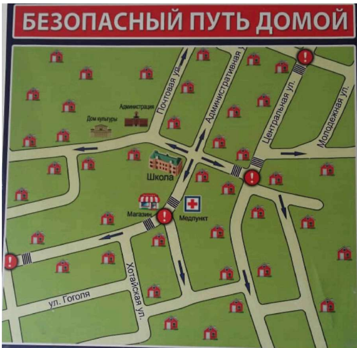
Схема «Школа-дом- школа»